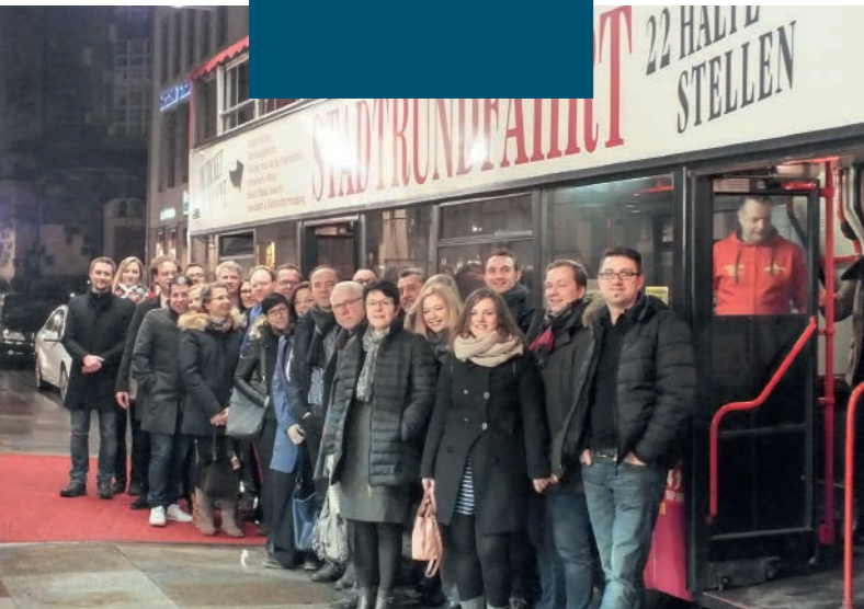
Kick-off-Party: Stimmungsvoller Start mit Freunden und Partnern der Sektion