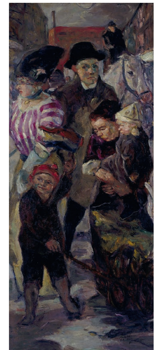
Max Beckmann, Die Straße (Teil einer großformatigen Straßenszene, die Beckmann 1928 zerschnitten hat), 1914, Berlinische Galerie