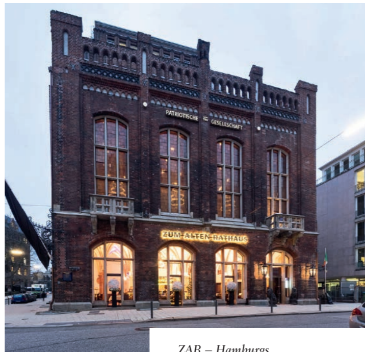
ZAR – Hamburgs neue Gastgeber im Banken- und Börsenviertel

Es ist ein Refugium, eine Hamburger Kostbarkeit und bereitet Vergnügen, unter Einfluss der traditionellen hanseatischen Küche wurden unserer Hamburger Sektion viele Köstlichkeiten serviert, zum Beispiel: