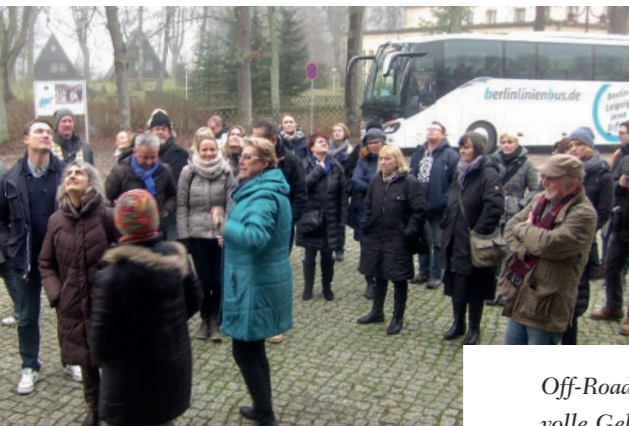
Off-Road in der Schorfheide: Bei unserem alljährlichen Event musste dieses Mal jeder volle Geländegängigkeit unter Beweis stellen