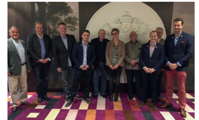
oben: Vier neue Mitglieder der Goldenen Schlüssel